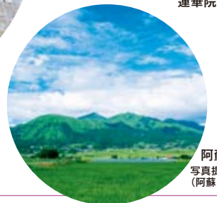
阿蘇 写真提供：熊本県(阿蘇、熊本城)