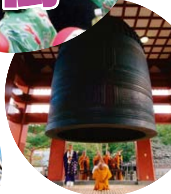
蓮華院誕生寺奥之院