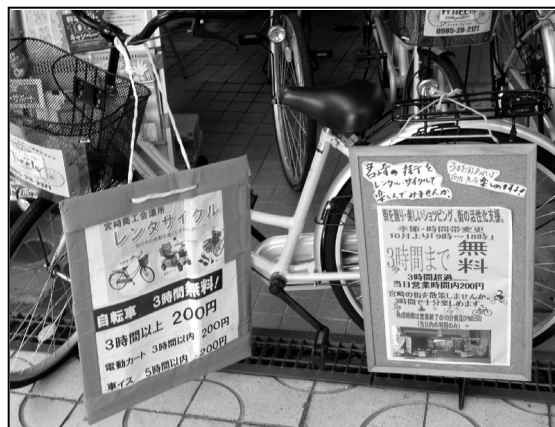
「レンタル・ウィールズの様子」～外観（左）、店頭の手づくり案内板（右）