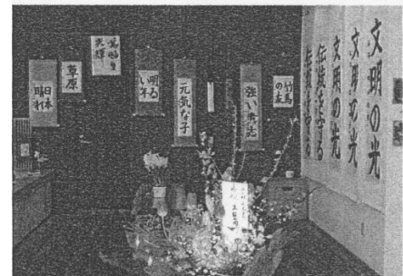
書道展（静泉書道教室作品展）

各店で手荷物預かり、駐車場までの運搬を行うとともに、預かり可能な店舗の案内を実施した。