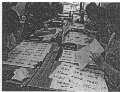
実用筆文字教室の様子