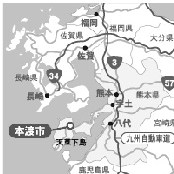
本渡市の地図

本渡市の区域は、本渡瀬戸海峡をはさんで天草上島と下島に広がり、四季の変化に富み、柑橘類の栽培などに適したところである。明治6年、天草支庁が富岡町から町山口村（現在の本渡市）に移され、このころから本市は天草の政治、経済、教育、交通の中心として発展してきた。昭和41年の天草五橋の開通、平成9年の熊本港～本渡港を結ぶ超高速船“マリンビュー”の就航、同12年春の福岡間・熊本間を結ぶ“天草空港”の開港によって、陸・海・空のすべての交通アクセスが整備され、産業の発展とともに天草地域の中核都市となっている。