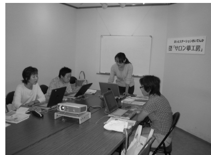
パソコン教室の様子