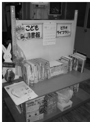
こども図書館の様子