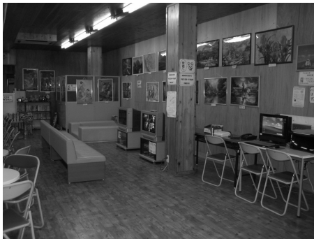
「えびす町子どもランド」の様子