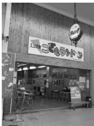
「えびす町こどもランド」外観