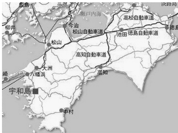
宇和島市の位置（宇和島市のHPより）

そこで、市内中心部に位置する全長約600mの直線型アーケード街で、袋町商店街（82店舗）、新橋銀天街（48店舗）、恵美須町商店街（28店舗）の3商店街からなる「宇和島きさいやロード」の活性化を図ることとなった。平成14年度には3商店街の共同事業として、“新春初売りイベント”を実施したが、一過性の効果しか得られなかったという反省から、平成16年度はコミュニティ施設を整備し、継続的な商店街の賑わいづくりに取り組むこととなった。