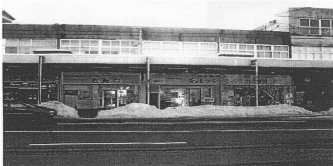
3店舗並んだチャレンジショップ

平成15年度に行ったチャレンジショップ事業は、隣接する2店の空き店舗を活用するものであった。今回3店舗目は、その2店と隣接する空き店舗での出店とした。（つまり、チャレンジショップ3店舗が隣接して並んでいる。）これは、3店舗が連続して並ぶことにより集客力の向上を狙ったものである。