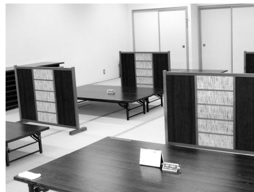
高齢者交流施設（ナナ・ビーンズのHPより）