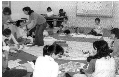
子育てランド あ〜べ =内部（左）、子育て支援交流事業風景（右） （ナナ・ビーンズのHPより）