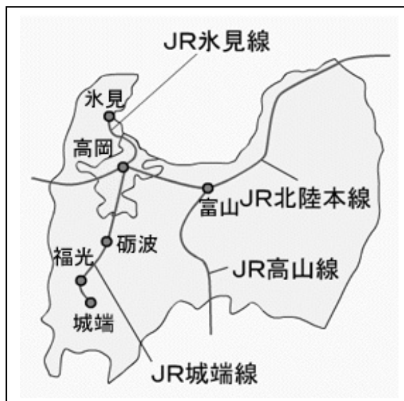
高岡市の位置（高岡商工会議所 HP）

このような状況を受けて市街地では、高齢化社会の更なる進展を考慮に入れ、福祉に重点をおいたサービスを模索するとともに、高岡法科大学の学生や地域住民、店主らが交流できる街づくりを行っていくこととした。その一環として本事業では、高齢者が楽しみ、憩うことができるコミュニティ施設の整備・運営を行った。