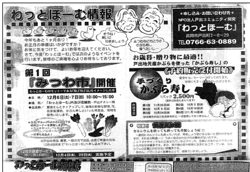
「わっとほーむ」のチラシ

12月6日(土)、7日(日)の午前10時から午後3時に実施。農協とタイアップして、大根やサトイモなどの地場の新鮮な野菜、花、自家製漬物、かぶら寿しなどの特産品を販売した。また、当日は障がい者グループによる喫茶コーナーも開設された。