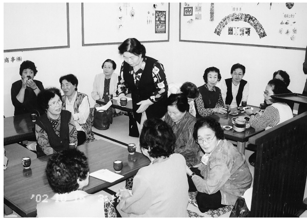
ふれあいサロン～外観（左）、内部（右）