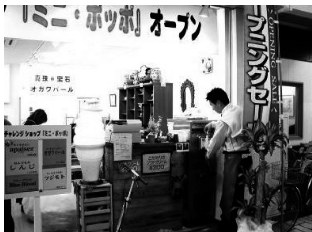
オープニングセール風景