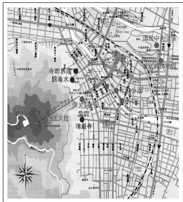
徳島市中心部の地図

ポッポ街商店街内にある空き店舗1店、47㎡を5つのブース（1ブース約8㎡）に区切り、チャレンジオーナーズショップ「ミニ・ポッポ」会と名づけ、共同店舗として運営する。