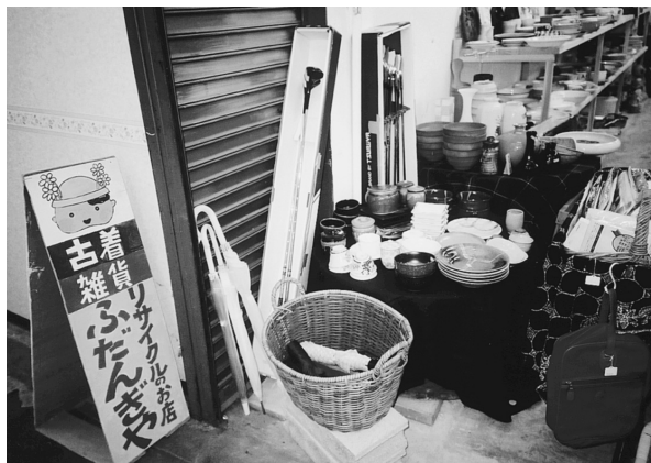
リサイクルショップふだんぎや (阪急桜井市場内)