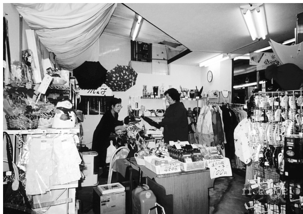
ゆめM&T (桜井スーパーマーケット内)

「市場のギャラリーで現代アートをみましよう」をキャッチコピーに誕生したギャラリー。美術を通じて作家と市民の集いの場の提供。