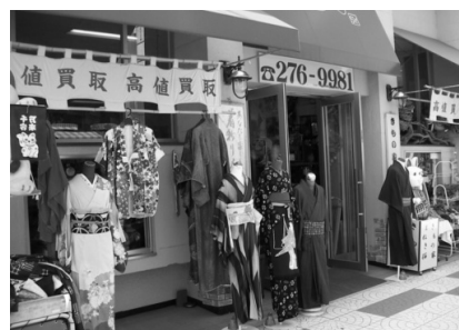
▲迫力ある正面入口