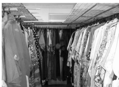
▲商品点数は正確には不明だが5,000点以上とか

着物雑誌(全国誌)で紹介されたことから、青森、沖縄をはじめとする遠隔地から来訪する客もたまにいるが、約8割の顧客は水戸市・日立市に居住する、店主との昔からの馴染み客である。コミュニケーションを大切にし、お金だけでなく買う人・売る人にハッピーになってもらいたいとの思いが強い。そして、お客さんの輪を広げていきたいと考えている。店内には休憩コーナーがあり、ゆっくりと会話を楽しみ、着物について談義するスペースが設けられている。