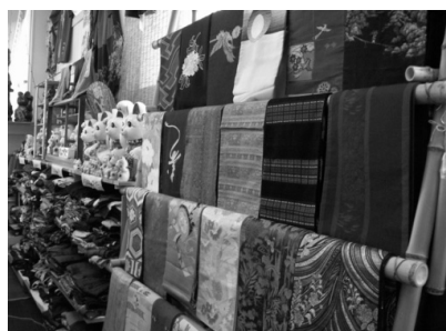
▲帯コーナー(手前)、はぎれコーナー(奥)