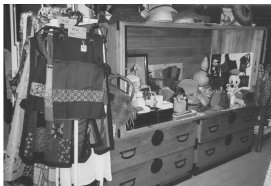
▲古い家具を使った展示

その後、30歳で実家に戻り家業に就き、上土手町商店街振興組合の専務理事という大役も担っている。東京から戻ってきた当時は郡部や県内の呉服屋への糸の卸売業が盛況で、年商1億円以上の商いをしていた。