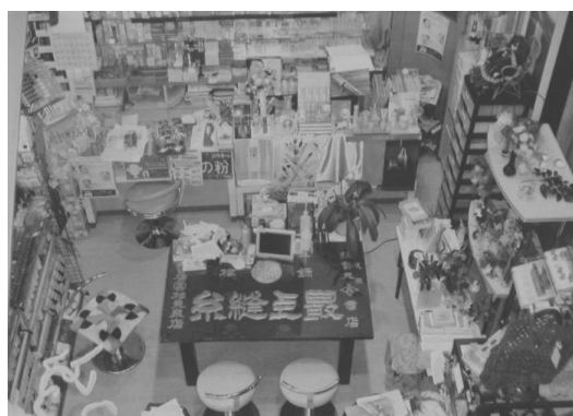
▲古い看板を使った接客テーブル

売場の1階と2階に分けて糸と関連するボタン、毛糸、手芸用の布などの商品を幅広く品揃えしている。また、1階に置かれている小物を陳列している大きな棚は、お嫁さんとして嫁いできた「嫁入り道具」である。