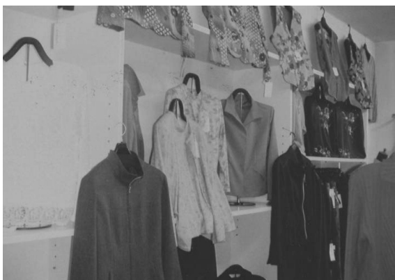
▲カジュアル衣料品の展示

主な対象顧客は40代以上の女性で、主にカジュアル衣料を中心に品揃えをしている。また、商品の仕入れに当っては毎月1回、東京の衣料品問屋が集中している東京・横山町まで足を運んでお客様をイメージして合う商品の仕入を行っている。