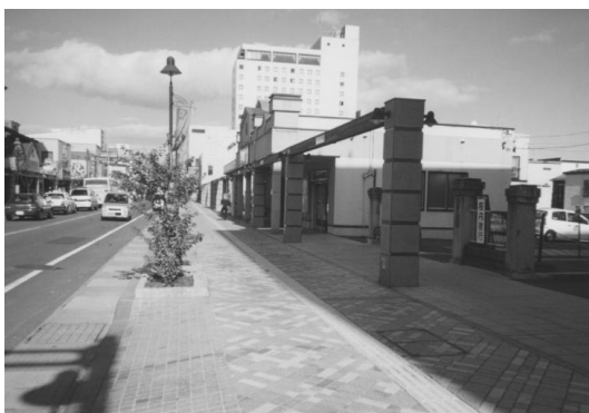
▲街路整備事業が終わった街路

その商店街の通り沿いにある杉見糸店の創業は明治43年で、現在の店舗のあるところで糸の卸売業として創業している。現在の経営者は4代目で学校を卒業した後、東京で衣料品関係の卸会社で修業している。