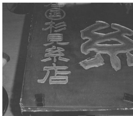
▲「杉見糸店」の古い看板

また、お客様によってはセーターなども特注品としてオーダーメイドで製造販売を行っている。さらに、お客様からの要望を聞いてお取り寄せサービスなども行い、顧客の固定化に努めている。