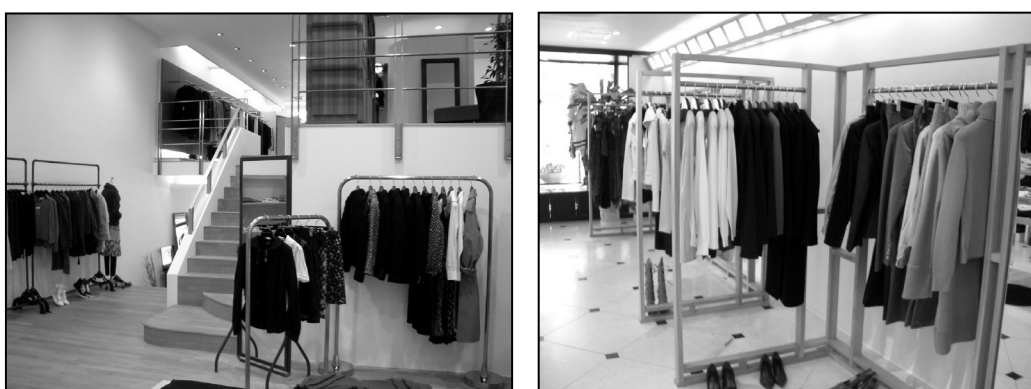
▲広い店内はブランド毎にコーナーが別れている。

同店のファンが増える大きな理由の1つが、スタッフのコーディネート提案力である。顧客の購買動機、要望を自然に聞き取り、コーディネート提案を行うという流れが出来上がっている。また、店内はブランド毎に様々なシーンを演出したディスプレイ陳列がなされ、お客様がイメージしやすくなっている。