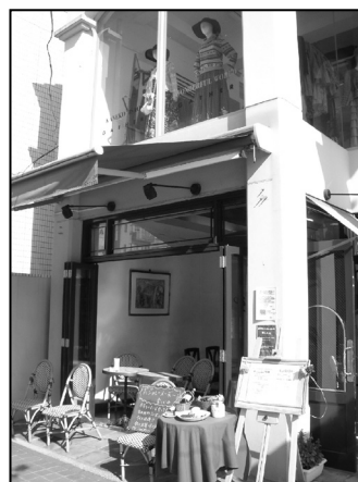
▲カフェ「シャーボン」

“こういう店があれば良いな”をおしゃれな形で実現していくことが、「ギャザー」というブランドイメージを作り出し、固定ファンを増やすことにつながっている。