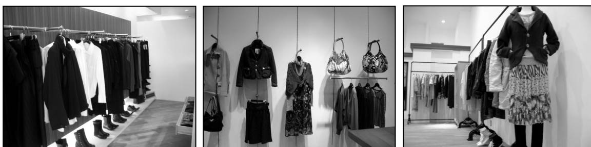
▲様々なシーンを演出したコーディネート陳列

株式会社ギャザーでは、このように商品の仕入れを任せたり、ファン顧客を増やしたりできるようなスタッフの育成に力を入れている。