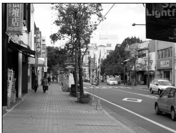
▲唐人町商店街の様子

佐賀市唐人町商店街は、佐賀駅と佐賀城跡を直線で結ぶシンボルロードに位置し、市内一番の中心街として市外、県外から訪れる人で賑わってきた。しかし、郊外大型店の進出、博多への消費の流出等により来街者は減少を続け、空き店舗率は11%となっている。