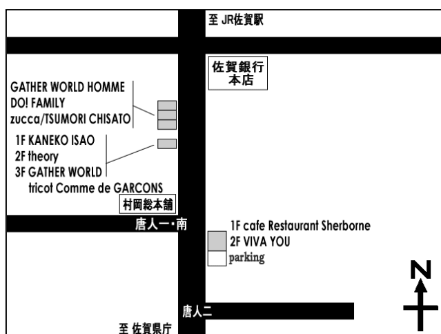
▲唐人町商店街内のギャザーの店舗配置図

ファッション不況が叫ばれる中、株式会社ギャザーの売上は平成 13 年以降毎年、前年比 125～130%で推移している。新規出店で店舗が増えただけでなく、既存店も好調で、例えば、本店の平成 17 年の客数は前年比 140%であった。自他共に認める佐賀県のファッション業界のリーディング・カンパニーとして成長を続けている。