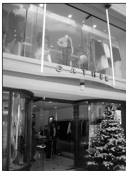
▲本店のショウウィンドー

株式会社ギャザーは、昭和61年、唐人町商店街に約8坪の小さな婦人服店にて創業した。平成元年には佐賀市呉服元町に2店目を出店。地元ファンを増やし売上も順調に伸ばす。その後、平成12年にイオンショッピングセンター(以下、イオンSC)